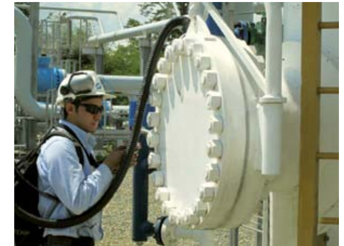
Figura 1. Detección y Medición de Fugas con cámara Infrarroja y muestreador de alto caudal.