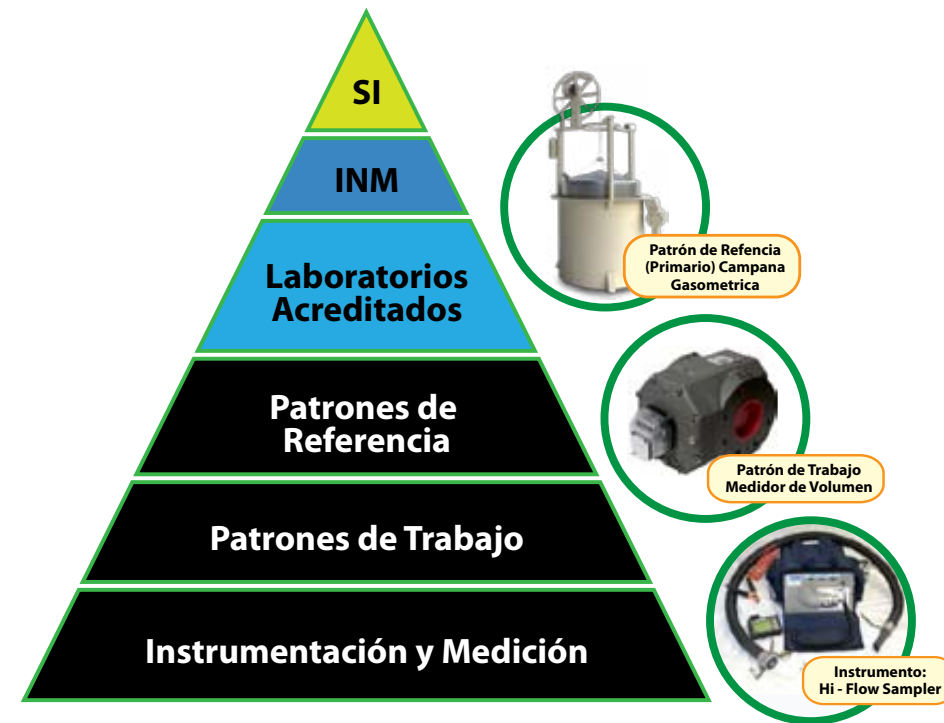
Figura 2. Esquema de Trazabilidad.

De esta forma, un adecuado conocimiento de la incertidumbre del equipo ha permitido adoptar mejores prácticas en el proceso de medición, e inclusive identificar oportunidades de mejora respecto a su desempeño metrológico.